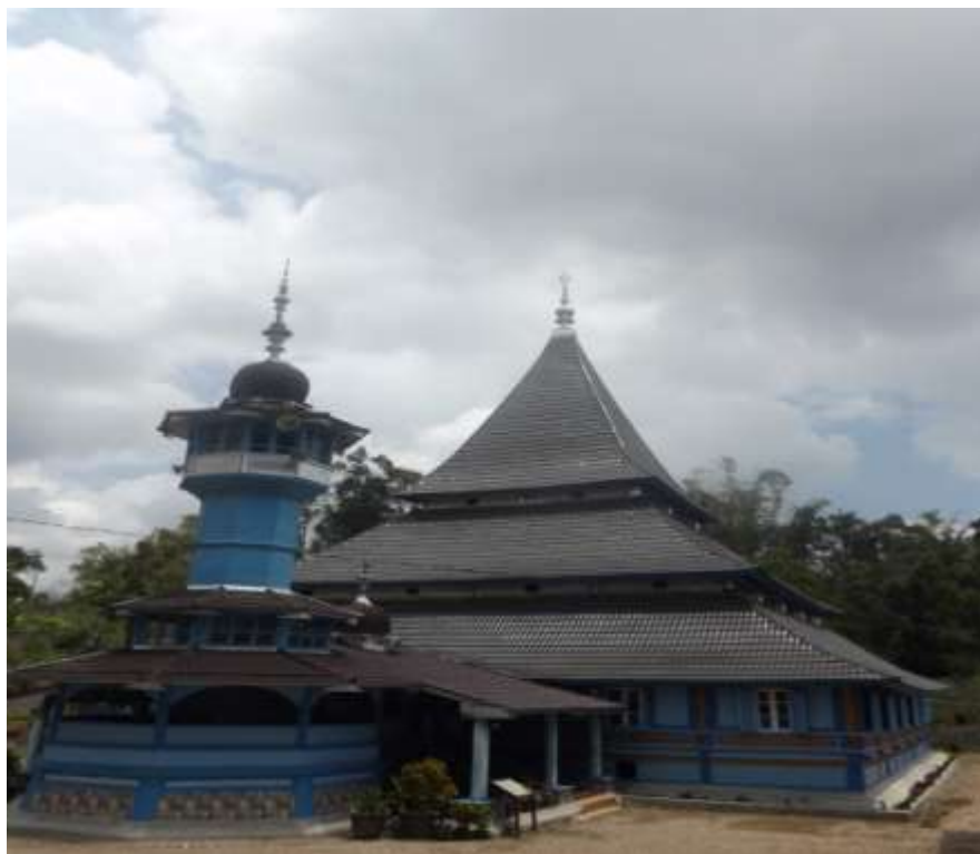
Gambar. 1 Masjid Raya Bingkudu, Candung, Agam

Seni arsitektur masjid diluhak agam merupakan bagian dari seni arsitektur khas melayu nusantara yang memiliki nilai seni estetika yang tinggi. Kita mengenal berbagai macam arsitektur masjid diantaranya ada yang bercorak Arab, India, Turki, Persia, Indonesia hingga di luhak agam minangkabau pun punya corak tersendiri dengan nilai estetis dan falsafah yang tinggi. Tidak hanya rumah adatnya tapi rumah ibadahnya berupa masjid di luhak agam merupakan sebuah warisan material culture yang menggambarkan tentang kemegahan budayanya, dimana masjid tidak hanya sekedar simbol kereligiusan masyarakatnya tapi juga menggambarkan kejenius lokal masyarakatnya dalam membuat sebuah arsitektur. Masjid-masjid tersebut masih berdiri kokoh dan dapat ditemukan hingga sekarang. Seni arsitekturnya terus berkembang dari masa ke masa dengan bentuk ciri khas dan unik seperti gambar dibawah ini.