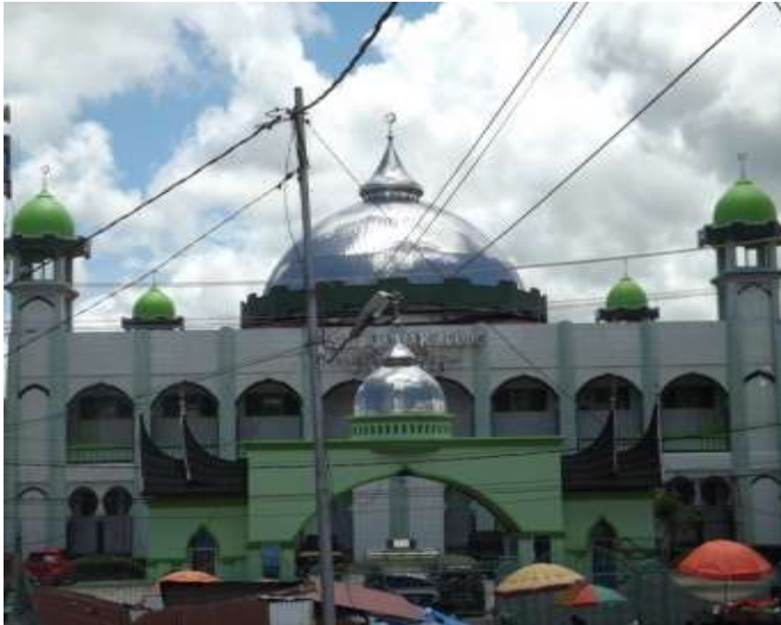
Gambar. 14 Masjid Agung Tangah Sawah Bukittinggi