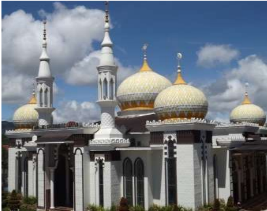
Gambar. 16 Masjid Raudhatul Jannah Bukittinggi