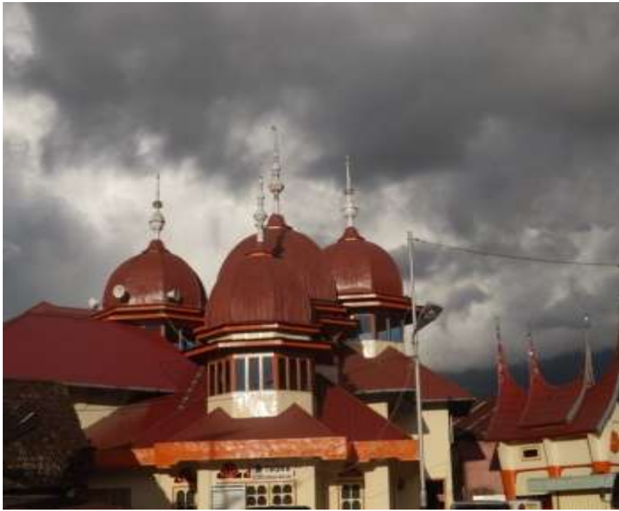
Gambar. 13 Masjid Takwa Sungai Buluh, Agam

Kubah adalah adalah bentuk bagian atap yang dibuat melengkung dan mengerucut pada bagian ujungnya yang menghiasi atap, bentuknya pun dapat beragam, boleh jadi seperti separoh bola atau kubah piring (lebih rendah dari kubah separoh bola) atau kubah bawang (karena seperti bawang) dan terkadang pada bagian puncaknya dapat diberi seperti gonjong rumah adat dan terkadang dihiasi dengan lambang bulan sabit.