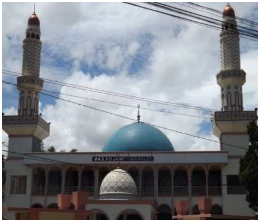
Gambar. 17 Masjid Jamik Tigo Baleh Bukittinggi