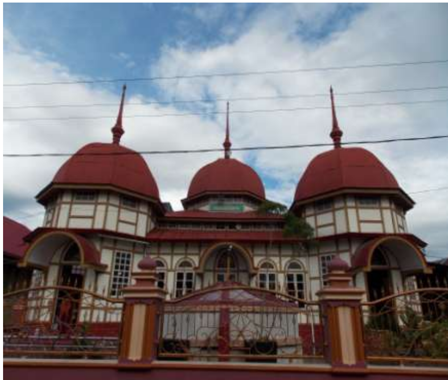
Gambar. 3 Masjid Jamik Parabek Bukittinggi