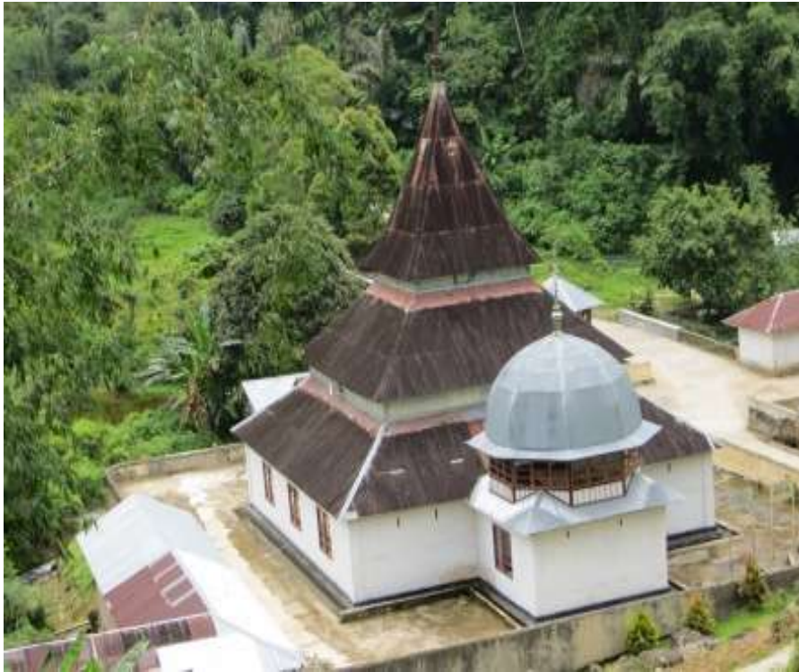
Gambar. 9 Masjid Pincuran Gadang Matur, Agam

Seni arsitektur masjid zaman klasik ini memiliki corak atau tipologi atap tumpang atau yang dikenal dengan vernukler . Karakter atau ciri khas masjid pada zaman klasik ini disamping beratap tumpang, ia dibangun diatas pondasi berbentuk bujur sangkar. Masjid ini memiliki jumlah atap tiga tingkatan yang semakin keatas semakin kecil dan mengerucut seperti limas dan pada bagian puncaknya dapat diberi seperti gonjong rumah adat dan terkadang dihiasi dengan lambang bulan sabit. Jumlah atap tumpang ini selalu ganjil yang dalam hal ini di luhak agam berjumlah tiga langgam dan bukan lima langgam seperti masjid-masjid tua di luhak Tanah Datar sebagai luhak nan tuo (luhak tertua).