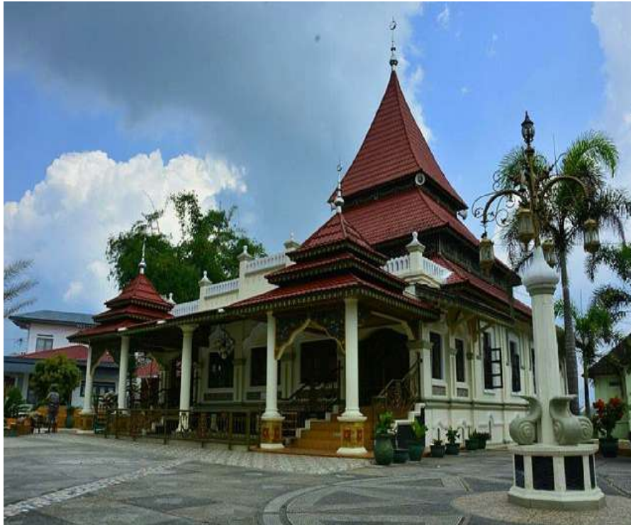
Gambar. 2 Masjid Jamik Taluak Bukittinggi