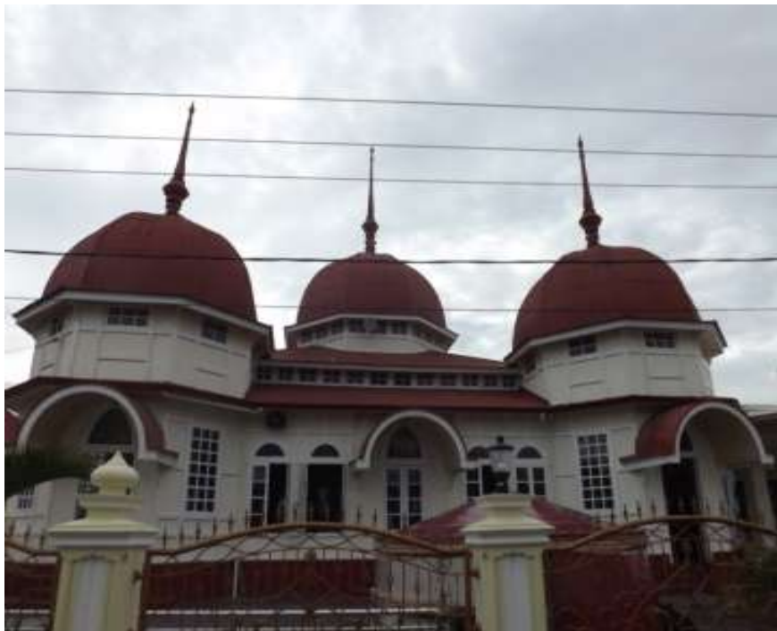
Gambar. 10 Masjid Jamik Parabek Agam

Apabila masjid zaman klasik dikatakan sebagai masjid generasi awal di luhak agam maka masjid zaman pertengahan atau zaman peralihan ini sebagai masjid generasi kedua diluhak agam dengan corak arsitektur yang berbeda. Adapun karakter dan ciri khas masjid di luhak agam pada zaman ini telah beralih dari yang dulunya bercorak dengan ciri atapnya berbentuk tumpang dan limas telah berubah menjadi masjid yang memiliki sejumlah kubah pada bagian atapnya. Hal ini dapat dilihat dari Masjid Jamik Parabek, Masjid Jamik Kapalo Koto Sungaipua, Masjid Jamik Batu Palano, Masjid Jamik Kapas Panji, Masjid Takwa Sungai Buluh dan lain-lain yang memiliki tipikal yang sama.