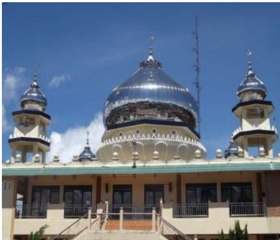
Gambar. 15 Masjid Muslimin Pintu Kabun Bukittinggi