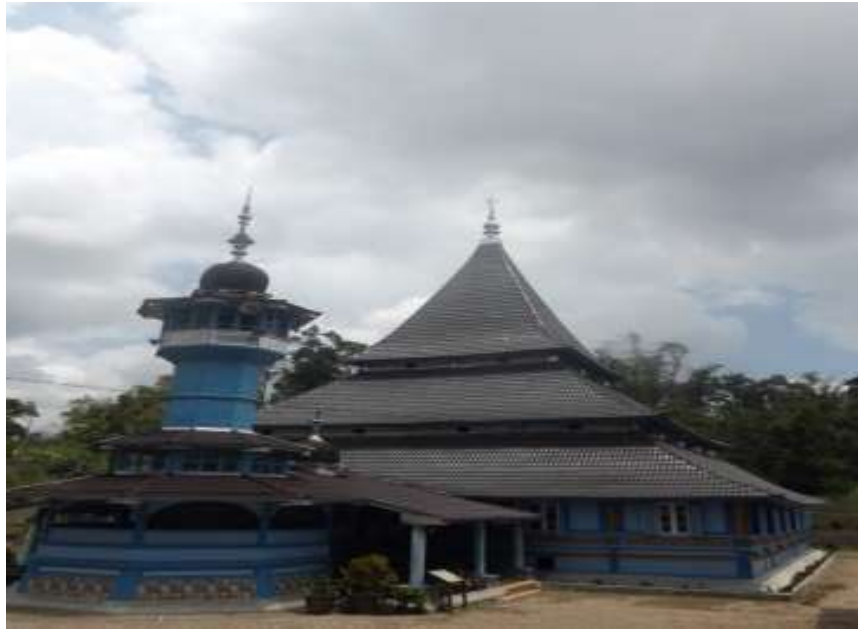
Gambar. 7 Masjid Raya Bingkudu, Candung