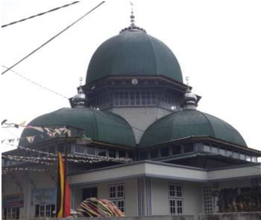
Gambar. 11 Masjid Jamik Kapalo Koto Sungaipua