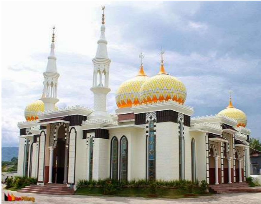
Gambar. 6 Masjid Raudhatul Jannah Bukittinggi

Selain itu, sejarah islam sejajar dengan sejarah perkembangan rumah ibadahnya. kemudian sejarah kaum muslimin menunjukkan bahwa perhatian yang besar bahkan berlebihan telah diberikan terhadap nilai-nilai arsitektur dan estetika sebuah masjid. Banyak dan beragamnya corak seni arsitektur masjid yang terdapat di luhak agam perlu dan menarik untuk diteliti sebagai bentuk pelestarian warisan budaya umat islam minangkabau sekaligus dapat dijadikan tempat-tempat tujuan wisata religi di luhak agam.