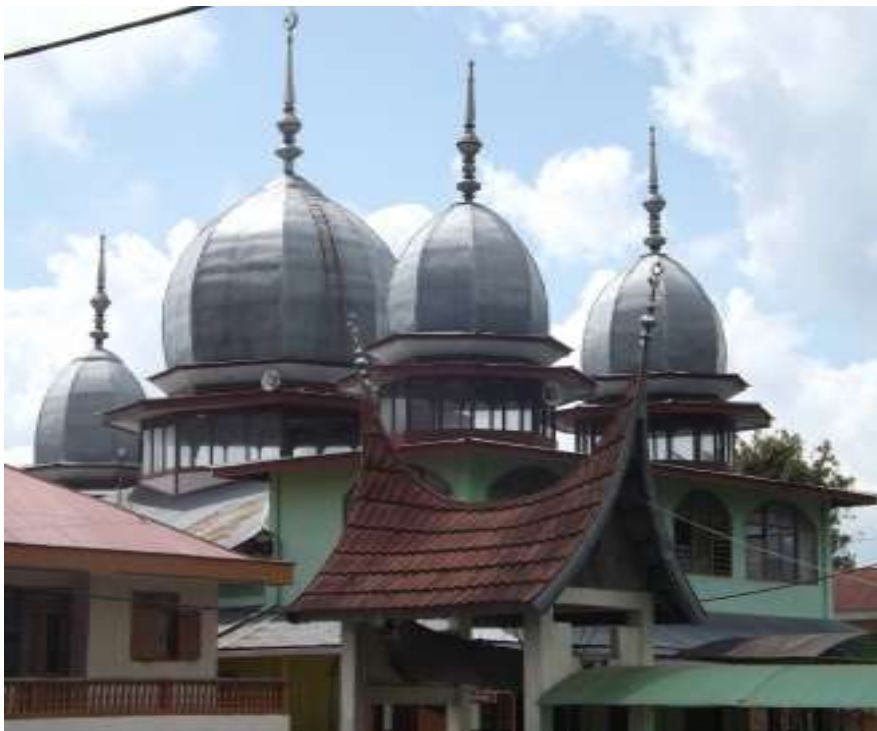
Gambar. 12 Masjid Jamik Batu Palano Agam