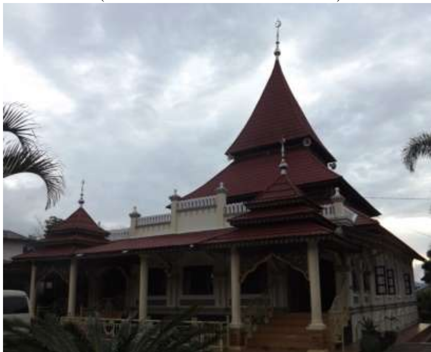
Gambar. 8 Masjid Jamik Taluak