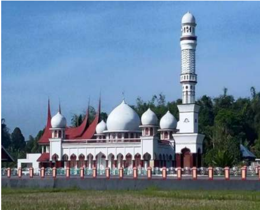
Gambar. 4 Masjid Jamik al-Syarif Kamang Magek, Agam